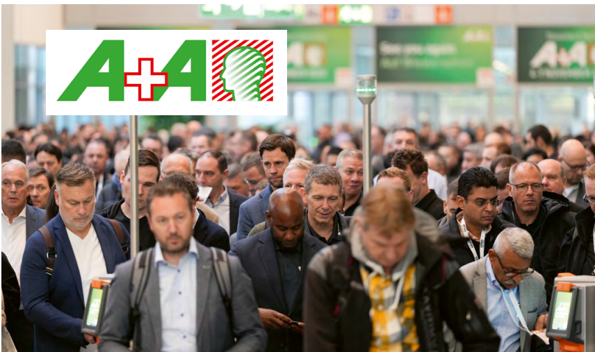
62.000 Menschen aus 140 Ländern besuchten Düsseldorf zur A+A, darunter die Gäste für den Tag der Sicherheitsbeauftragten.

Wie läuft es eigentlich so als Sicherheitsbeauftragte (SiBe)? Gelegenheit zum Austausch darüber gab der „Tag der Sicherheitsbeauftragten“ auf der „A+A Internationalen Fachmesse und Kongress für sicheres und gesundes Arbeiten“. Dort ging es um die Unterstützung, die SiBe sich im Arbeitsalltag für ihr Ehrenamt wünschen.